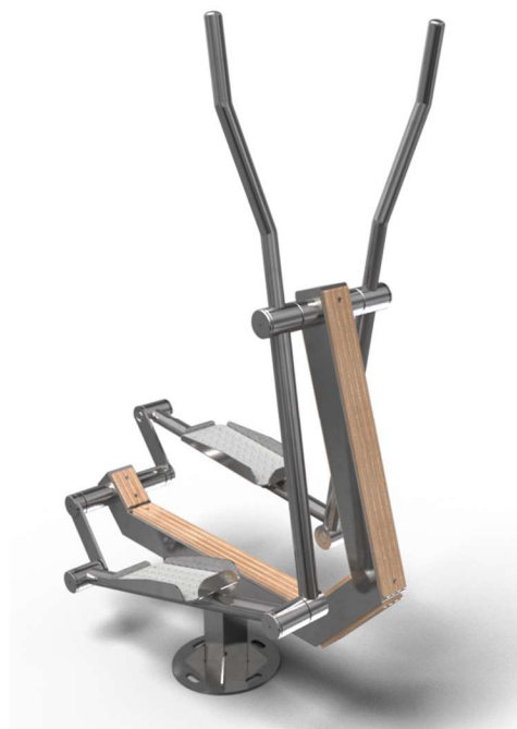
Vizualizace mají pouze ilustrační charakter Právo na změny vyhrazeno

Poznámka: Maximální hmotnost uživatele je 120 kg. Druhé osobě je zakázán vstup do vzdálenosti 2m do uživatele. Zařízení smí bez dozoru užívat pouze osoby s minimální výškou 140 cm. Jiné než uvedené použití je zakázané. Zařízení je v souladu s normou ČSN EN 16630.