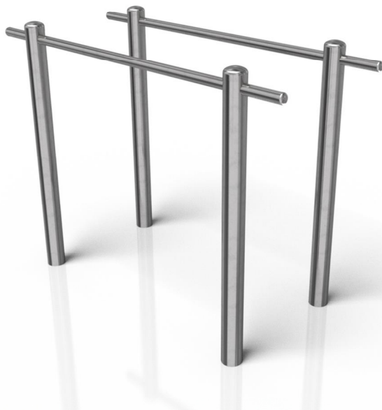
Vizualizace mají pouze ilustrační charakter Právo na změny vyhrazeno

Poznámka: Maximální hmotnost uživatele je 120 kg. Druhé osobě je do vzdálenosti 2 m od uživatele vstup zakázán. Zařízení smí bez dozoru užívat pouze osoby starší 14 let.